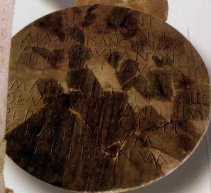
Altar închinat zeului Apollo